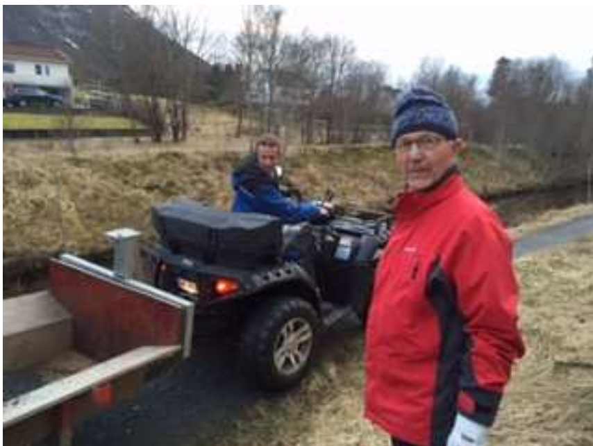
Sverre i kjent stil.

Alle som var med på dugnaden denne kvelden møttes ved Kvernhuset. Der vart det servert kaffi, sveler og kaker i kjent dugnadstil. Etter en god «kaffiprat» vart det heile avslutta.