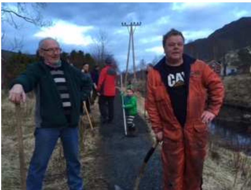
Bygdafolket stiller også opp.