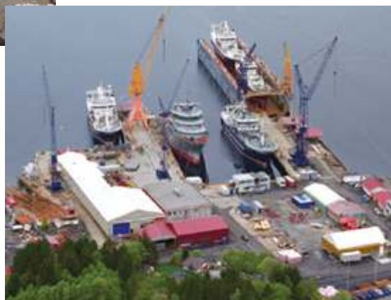
Myklebust Verft AS