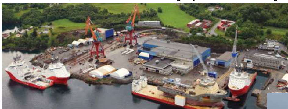
Kleven Verft AS

Kleven Maritime, med verfta Kleven Verft og Myklebust verft er i dag landets største norskeigde skipskonsern.